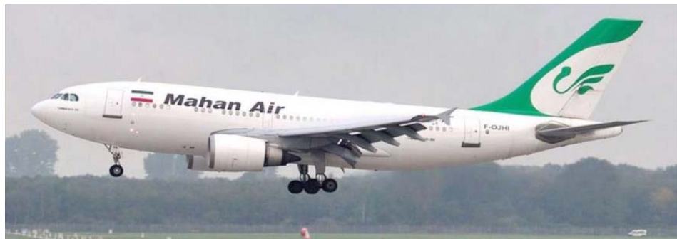
Catorce civiles resultaron heridos durante la acción contra avión iraní

T/ Redacción CO-HispanTV