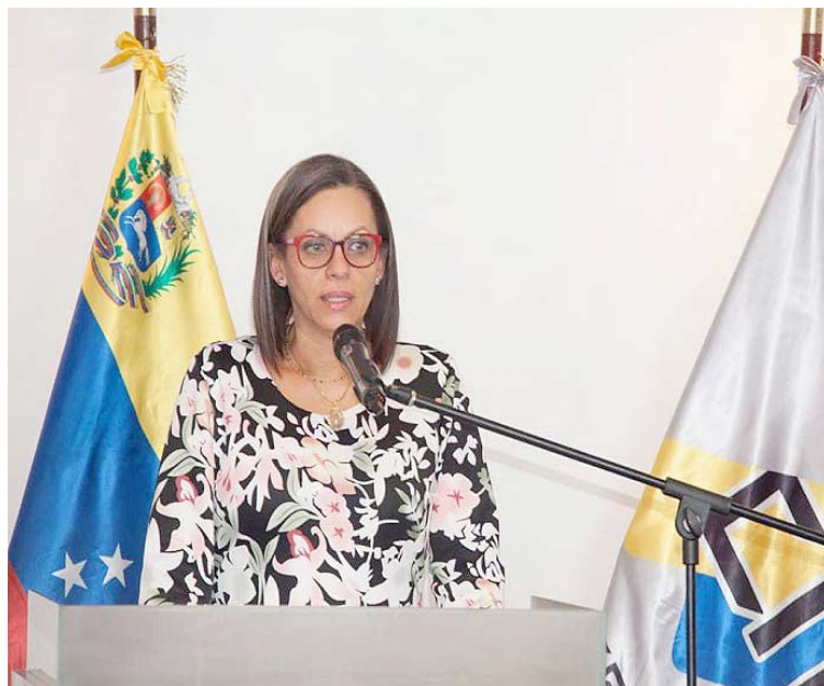
Indígenas escogerán a sus candidatos a mano alzada, tal como ha sido su uso y costumbre

El Consejo Nacional Electoral (CNE) publicó ayer en su página web el Reglamento Especial que regirá la elección de la Representación Indígena a la Asamblea Nacional 2020 para los comicios previstos para el 6 de diciembre de 2020. La normativa se ajusta a la decisión 068, de fecha 5 de junio del presente año, de la Sala Constitucional del Tribunal Supremo de Justicia, donde exhorta Consejo Nacional Electoral (CNE) a establecer un sistema de elección de los representantes indígenas en consonancia con los usos y costumbres de estas comunidades.