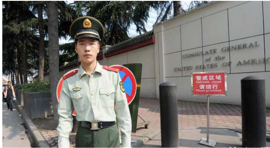
En 72 horas los diplomáticos estadounidenses deben abandonar Chengdu

La Cancillería del gigante asiático, mediante un comunicado, informó a la Embajada de Estados Unidos en China su decisión de retirar su consentimiento para el funcionamiento del Consulado General de los Estados Unidos en Chengdu y dio instrucciones precisas de suspender todas las operaciones y eventos de esta sede.