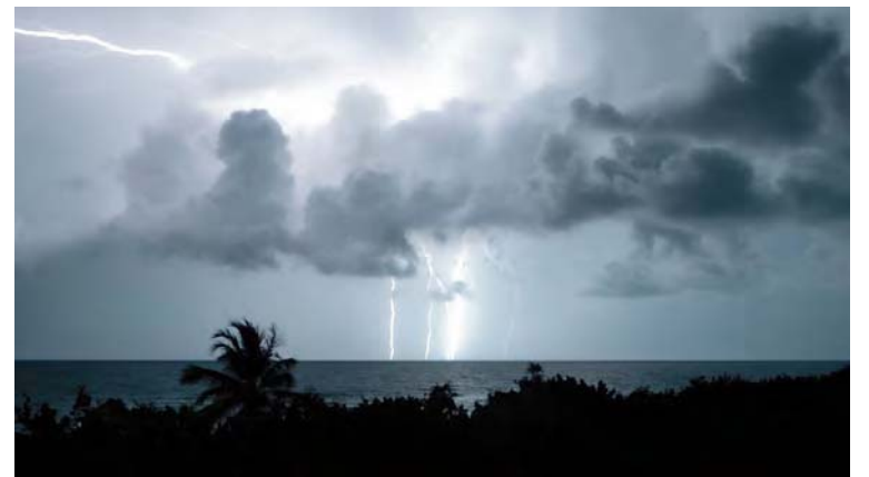
Hasta ayer presentaba vientos de hasta 85 kilómetros por hora

T/ Redacción CO-RT