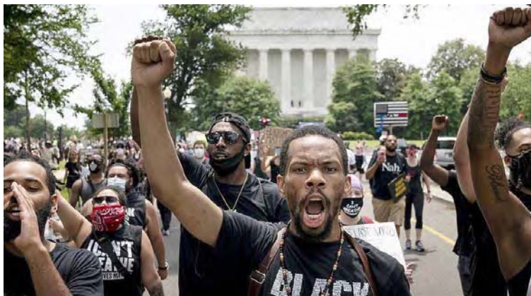
Desde mayo, en EEUU no cesan las protestas antirracistas tras el asesinato de George Floyd