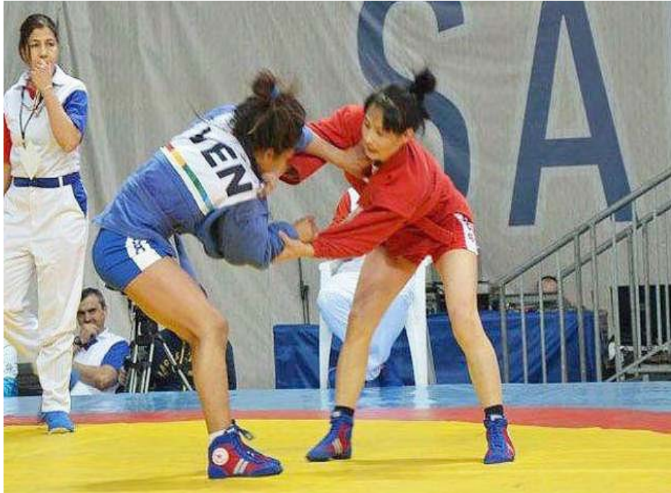
El deporte debe perfeccionarse en todas las áreas

Los temas tocarán actividad física y salud, rendimiento deportivo, tiempo libre, ocio y recreación, gerencia y ciencias aplicadas, entre otras