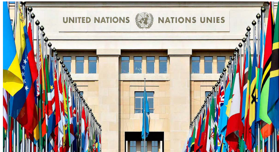
La empresa Petróleos de Venezuela está seriamente afectada por las sanciones impuestas por EEUU

Entre las causas de esta caída, Acnudh reconoce el impacto de las medidas coercitivas y unilaterales de Estados Unidos