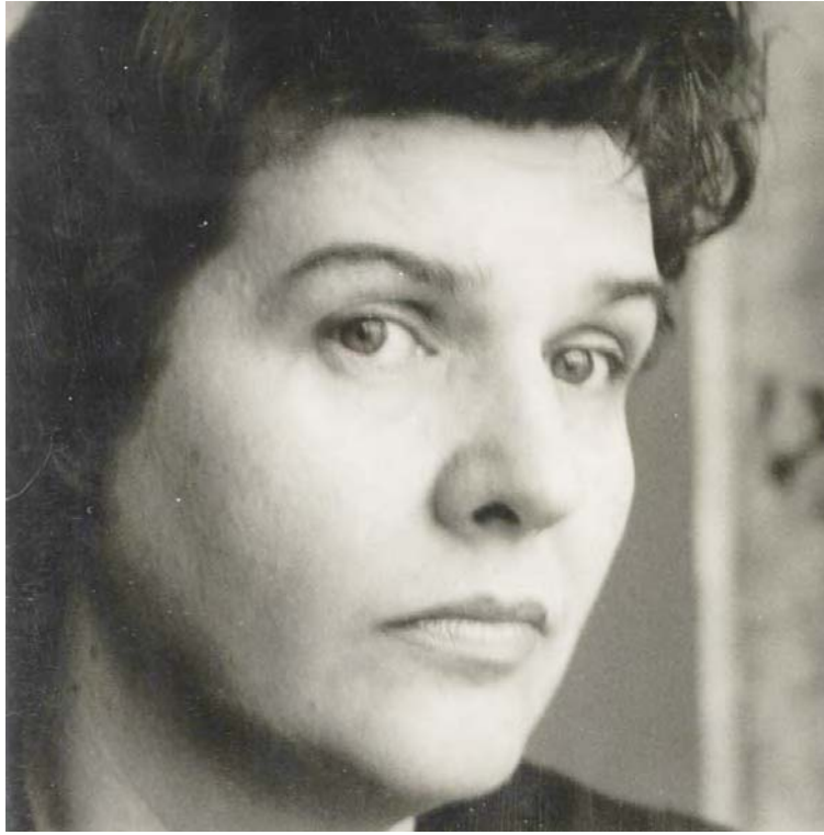
La propuesta estará disponible en internet durante un año

Incluye concurso de ensayos, exposiciones virtuales y presentación de materiales ilustrativos, fotografías y videos