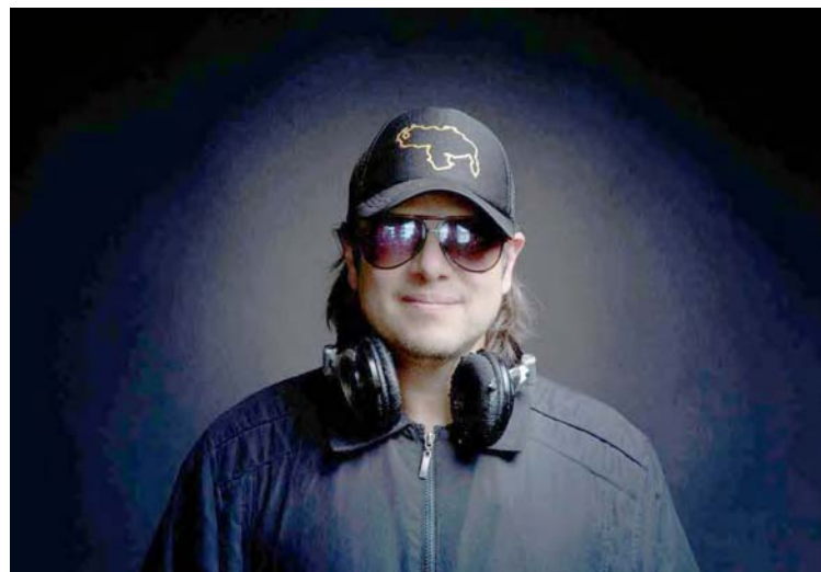
La lectura del poema está a cargo de la esposa del músico