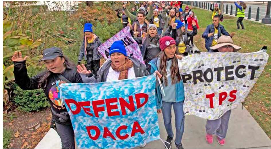
Migrantes jóvenes de EEUU exigen que se respete la Ley de Acción Diferida

Este programa, adoptado en 2012 por la administración de Barack Obama, permite a este tipo de migrantes aplazar su deportación y optar por recibir