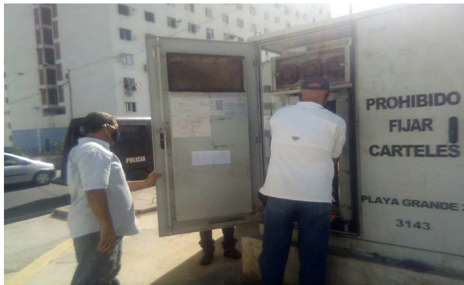
Cantv trabaja todos los días para conectar al país

Cantv reitera que este tipo de delitos y personas que los cometen no son reflejo de la mayoría de los trabajadores que