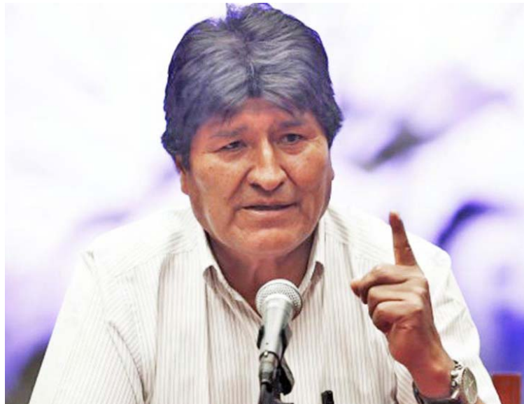
Áñez espera abrir las urnas electorales el 18 de octubre

E vo Morales denuncia presiones al Tribunal Supremo Electoral (TSE) de Bolivia para proscribir al Movimiento al Socialismo (MAS) en las próximas elecciones: “Tenemos informaciones del TSE de Bolivia en sentido de que hay presiones internas y externas para proscribir al MAS-IPSP (el Movimiento al Socialismo-Instrumento Político por la Soberanía de los Pueblos), lo cual sería como descuartizar, nuevamente, a Túpac Katari (caudillo de la etnia aimara) o fusilar a