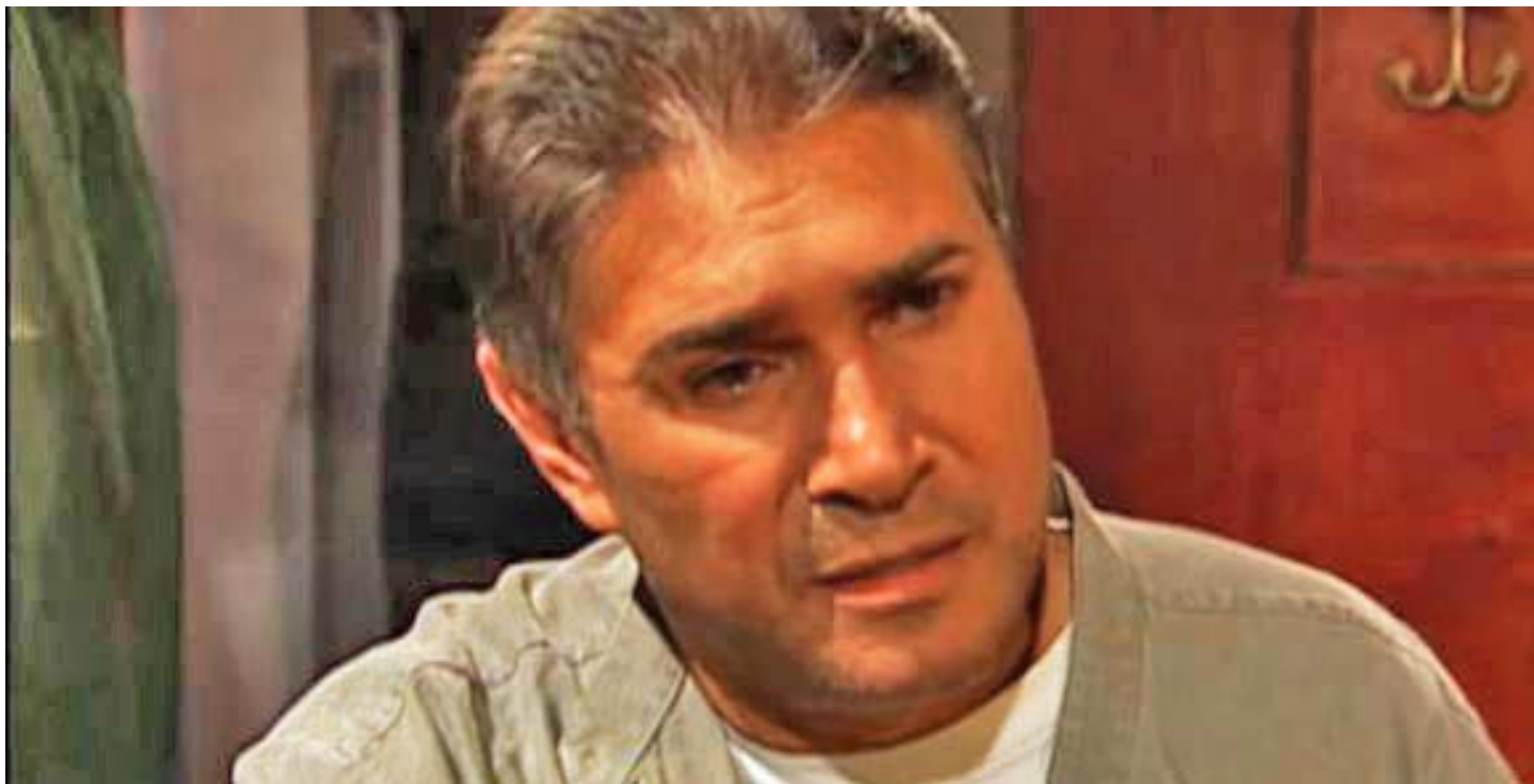
Cada uno de los directores ofreció una semblanza con su visión del actor

Desnudo con naranjas, Macu y El sangrador son las cintas seleccionadas