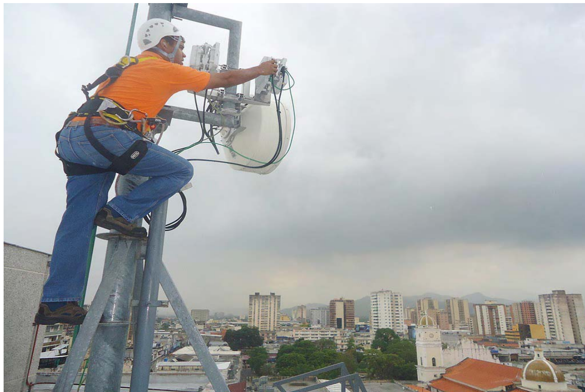
Movilnet mantiene sus instalaciones a tono

La promoción será válida solo durante el mes de agosto y aplica para aquellos clientes que adquieran su línea nueva GSM Prepago o realicen la recuperación de línea, afiliando los planes en los agentes autorizado nacionales y los agentes digitales movilnet, que puedes ubicar en nuestra cuenta de Instagram @SomosMovilnet_