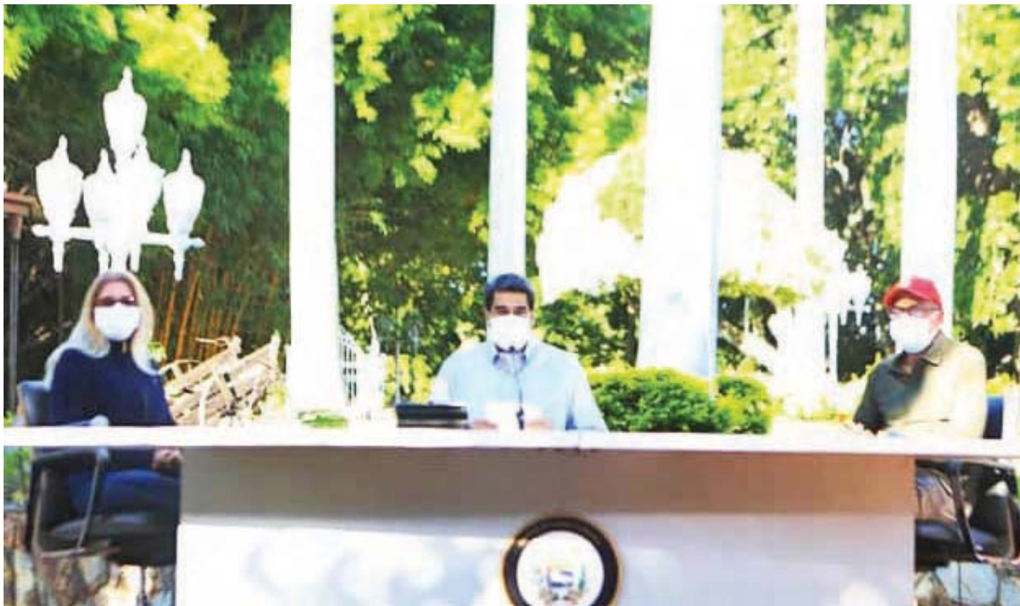
Maduro agradeció al personal médico y sanitario que sigue trabajando durante esta pandemia en el país

La cifra de contagios subió a 20.206 y la de fallecidos a 174