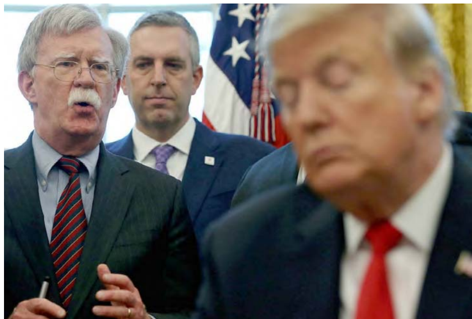
Estrategias de la política internacional de Bolton, que no convencieron a Trump

Cuando Maduro dice estar de acuerdo con Abrams, le quita la única vía de oxígeno que le queda a esa oposición. Sin Bolton, con Pompeo ocupado de otros asuntos, con Marco Rubio ausente, con el grupo de Lima desactivado y el Tratado Interamericano de Asistencia Recíproca olvidado, a la oposición solo le queda la esperanza de que vuelva el Abrams guerrero, pero en realidad se nota debilitado. Ya a nadie, incluido a Abrams le sorprendería que Bolton tuviera razón en eso de que es un escenario probable que Trump se reúna con Maduro. Y esa duda le genera desconfianza para operar con la rudeza que le caracteriza.