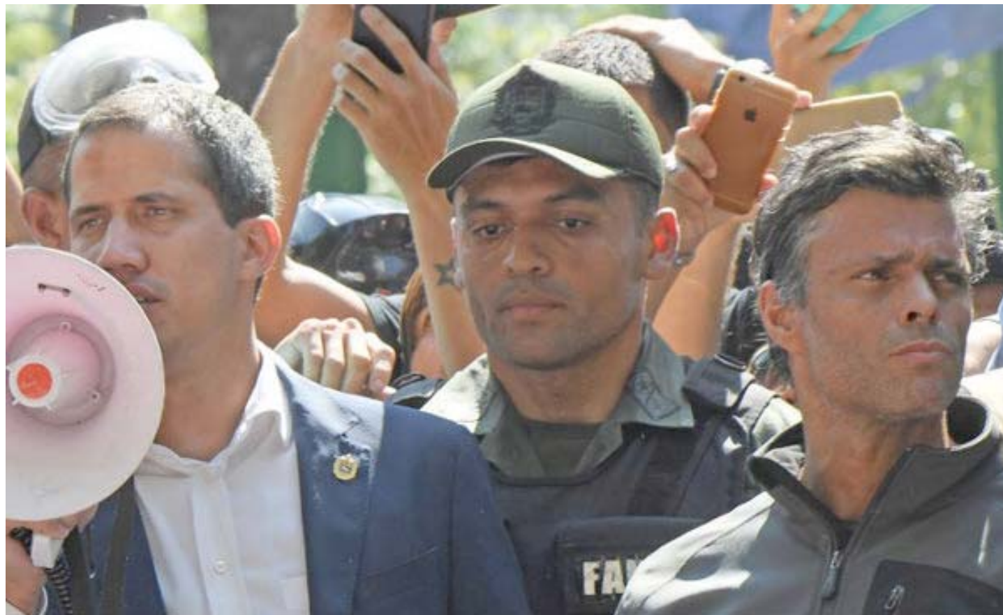
Un fallido intento de Golpe que le apagó los teléfonos a Abrams

Desde que Trump barajara la idea de dialogar con Maduro, y una vez que sacó de la campaña presidencial el tema de Venezuela, Abrams está fuera de la jugada y las intenciones de los halcones, de intervenir Venezuela, han sido pausadas desde la propia Casa Blanca.