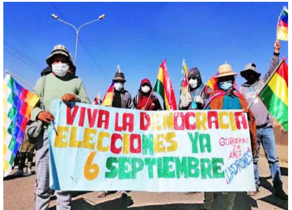
La Central Obrera Boliviana y otros movimientos sociales comenzaron un paro nacional

La presidenta de facto pidió a los dirigentes de la central de trabajadores