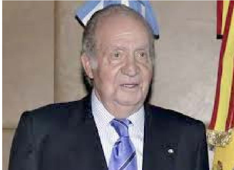
Creó una estructura para ocultar dinero de las supuestas comisiones en un banco suizo

T/ Redacción CO-Agencia RT