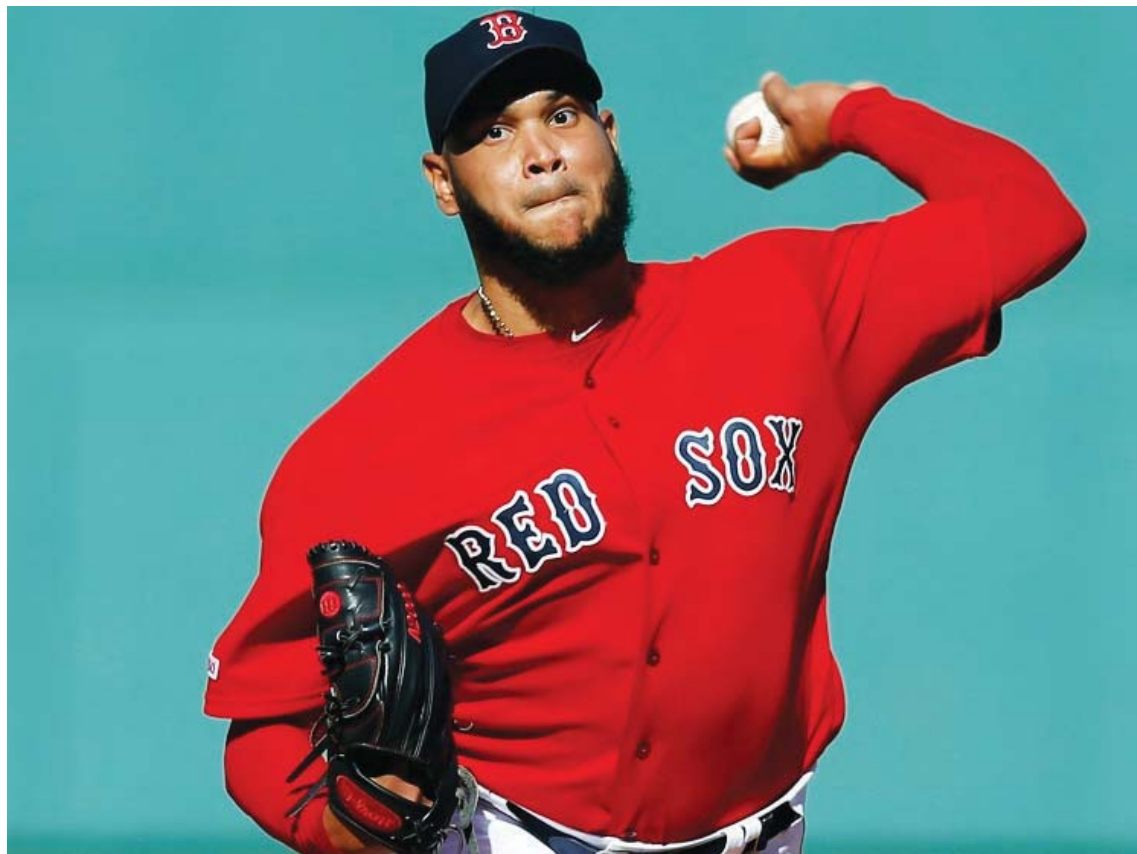
E-Rod ganó 19 partidos la zafra pasada

E-Rod completó en 2019 la mejor temporada de su carrera luego de dejar 19-6 con 3.81 de