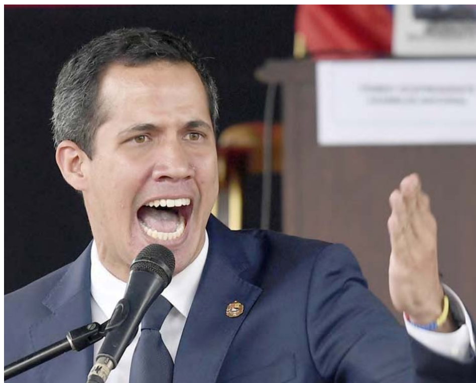
Un posible diálogo que pone nerviosa a la oposición venezolana

la política estadounidense contemporánea, cuando los halcones republicanos vendieron armas ilegales e impulsaron el narcotráfico en su propio país para financiar la guerra contra países centroamericanos.