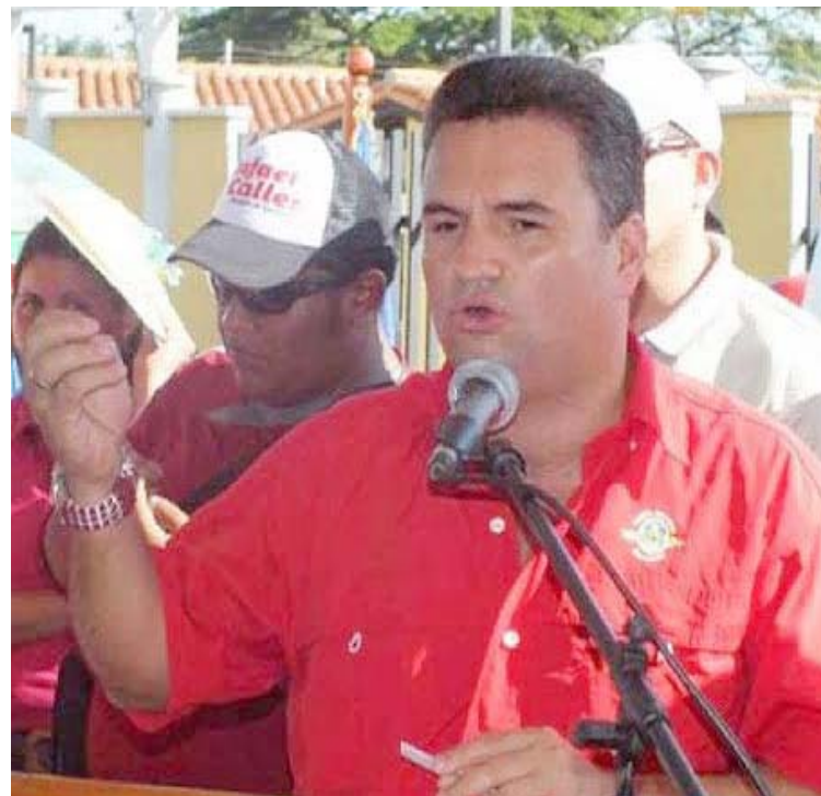
“Después del mediodía, todo debe estar cerrado”, indicó Calles

Sostuvo que estos son actos de irresponsabilidad, y llamó a la población de Portuguesa a seguir el ejemplo de los municipios San Genaro de Boconoito