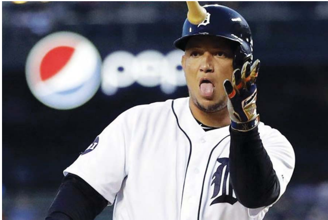
Miggy sigue labrándose su camino a Cooperstown