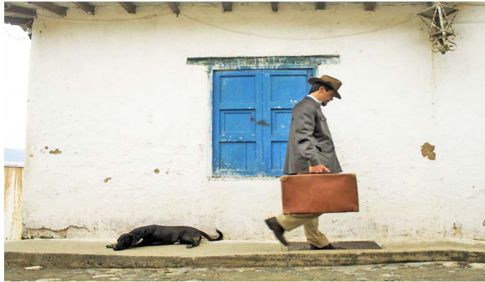
La producción estuvo a cargo de La Villa del Cine y Buena Hierba

La dupla venezolana, luego de conocer el veredicto, participó en una videollamada en la cual agradecieron “profundamente el amor con el que el Festival