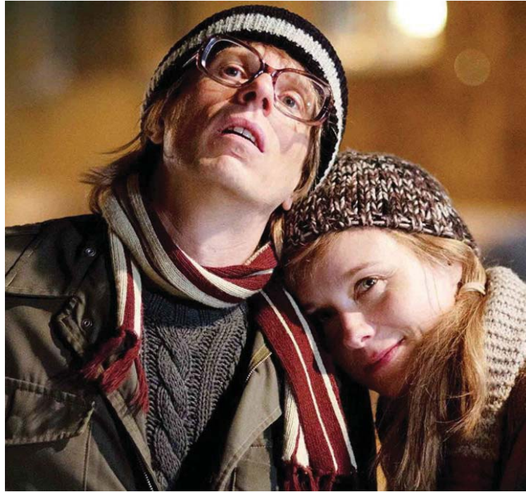
El filme Gundermann es inspirado en hechos reales