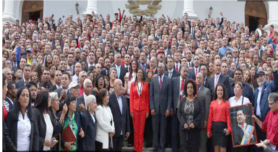
La ANC se instaló formalmente el 4 de agosto en el Palacio Federal Legislativo

La convocatoria para poner en marcha esta iniciativa la hizo el presidente Maduro durante su alocución del 1 de mayo de 2017 con motivo de la celebración del Día del Trabajador. Su planteamiento en ese momento fue convocar a una constituyente para derrotar los actos de violencia promovidos por sectores