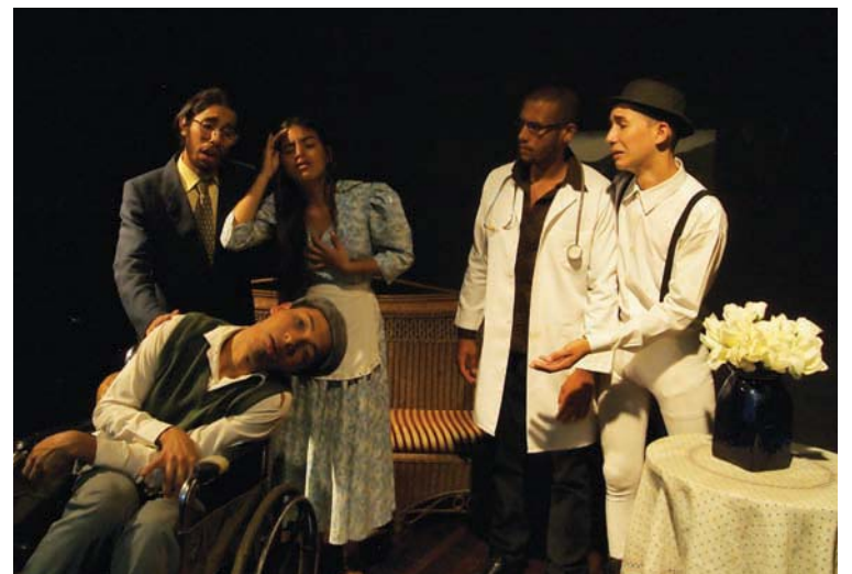
Ya se abrió el proceso de inscripción

Los cupos son limitados. Para mayor información se recomienda comunicarse por los números de teléfono 0412 951 95 50 y 0424 216 4977