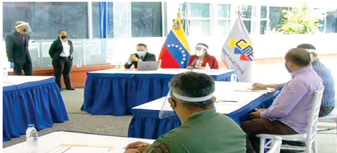
Se consolidan las garantías electorales con innovaciones tecnológicas