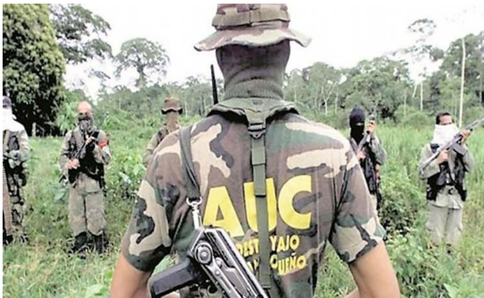
Uribe es señalado como uno de los creadores de las autodefensas colombianas

Cepeda (Polo Democrático Alternativo). Quería callarlo.