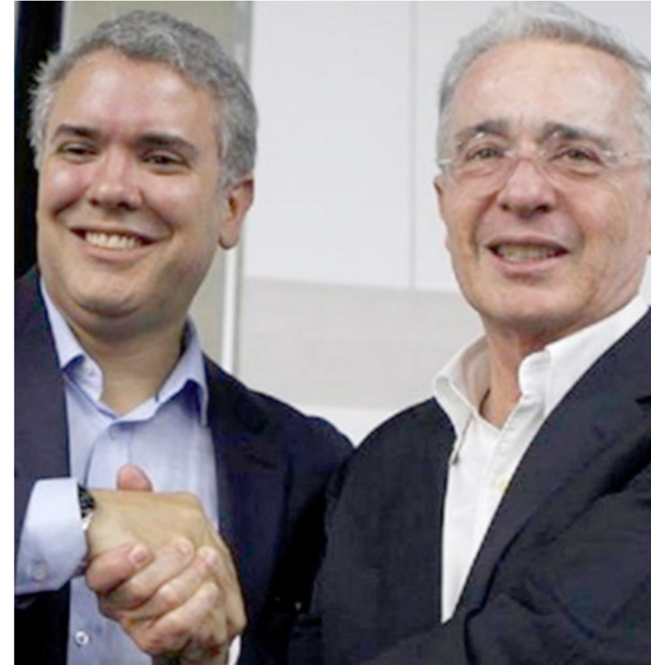
El actual Presidente colombiano recurre a la fe para defender a su mentor

licencias para el funcionamiento de pistas de aviación o para el tráfico de aeronaves. Ahh, se nos olvidaba, también autorizó el funcionamiento de una pista en la mismísima y famosa finca de Escobar Gaviria, la legendaria “Nápoles”, aquella donde se construyó un zoológico y que visitaron algunos famosos artistas que hablan hoy día de “decencia”... pero eso es otro cuento.