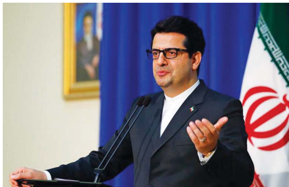
EEUU e Israel siempre han tratado de atrapar en aguas turbias

El secretario del Consejo Supremo de Seguridad Nacional de Irán, Ali Shamjani expresó su pesar al Gobierno y al