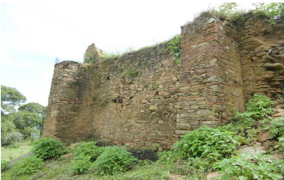
Ruinas del fuerte de San Vicente

ganizar el archivo, hacer publicaciones, montar actividades culturales”, señala.