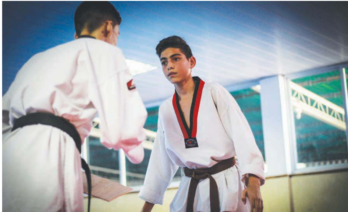
El taekwondo en todas sus especialidades produce preseas en el exterior