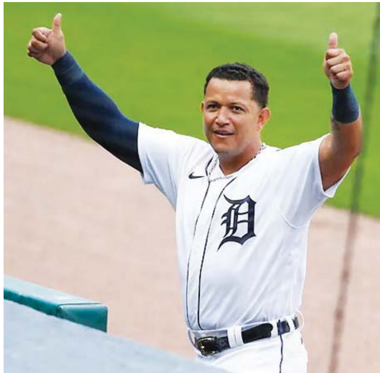
"Miggy" sigue haciendo historia en las mayores