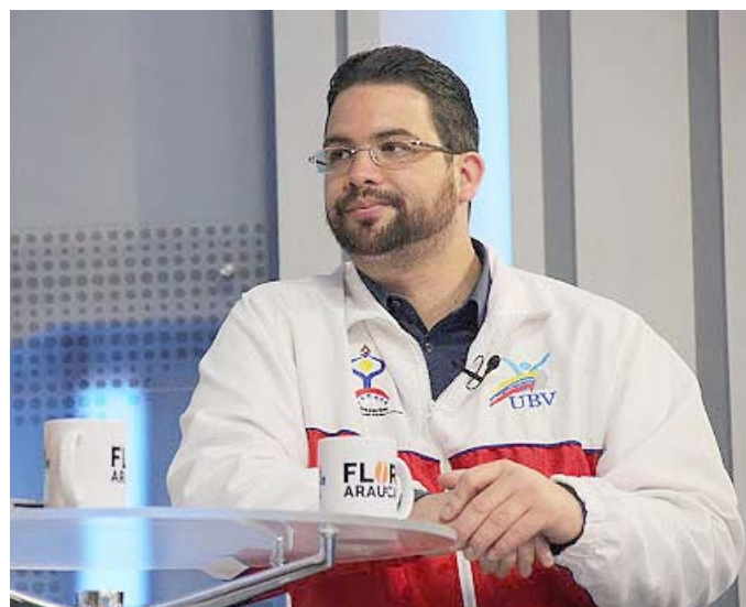
Las clases comienzan en septiembre, reiteró Trómpiz

Agregó que con los resultados recogidos se elaboran las orientaciones metodológicas que se implementarán en las materias y las carreras