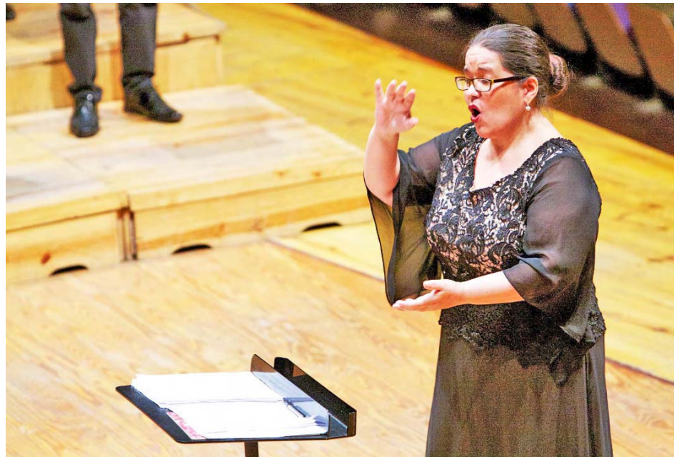
El evento se desarrollará del 16 al 20 de septiembre vía internet

El III Simposio Internacional Mujeres Directoras propiciará la creación de grupos de trabajo para desarrollar acciones en función de proponer y aplicar políticas culturales para la inclusión femenina en la música. Igualmente está previsto concluir el evento con la configuración de un Manifiesto que promueva la igualdad de oportunidades para las mujeres en la música. El encuentro está programado para realizarse del 16 al 20