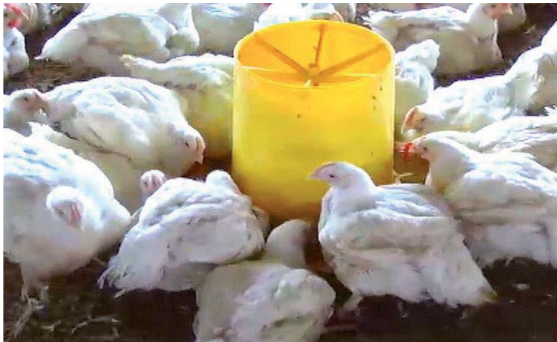
La buena cría de pollos es importante para la alimentación.

Asimismo, destacó que la producción por galpón es de 37 mil kilos por ciclo: “Producimos cinco ciclos de pollos al año, para un total aproximado de 150