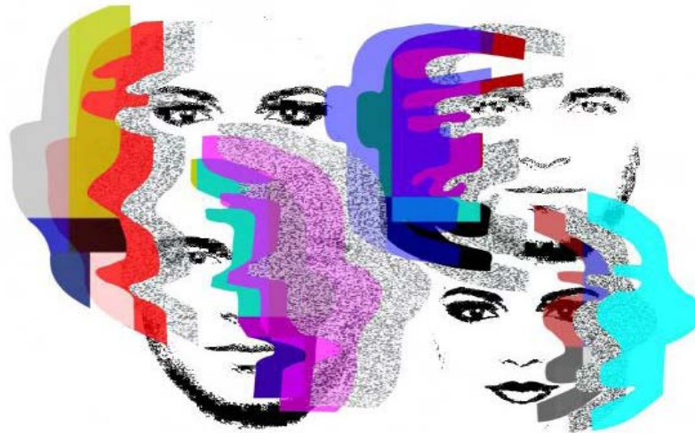
La propuesta combina el dibujo con el collage y la gráfica digital