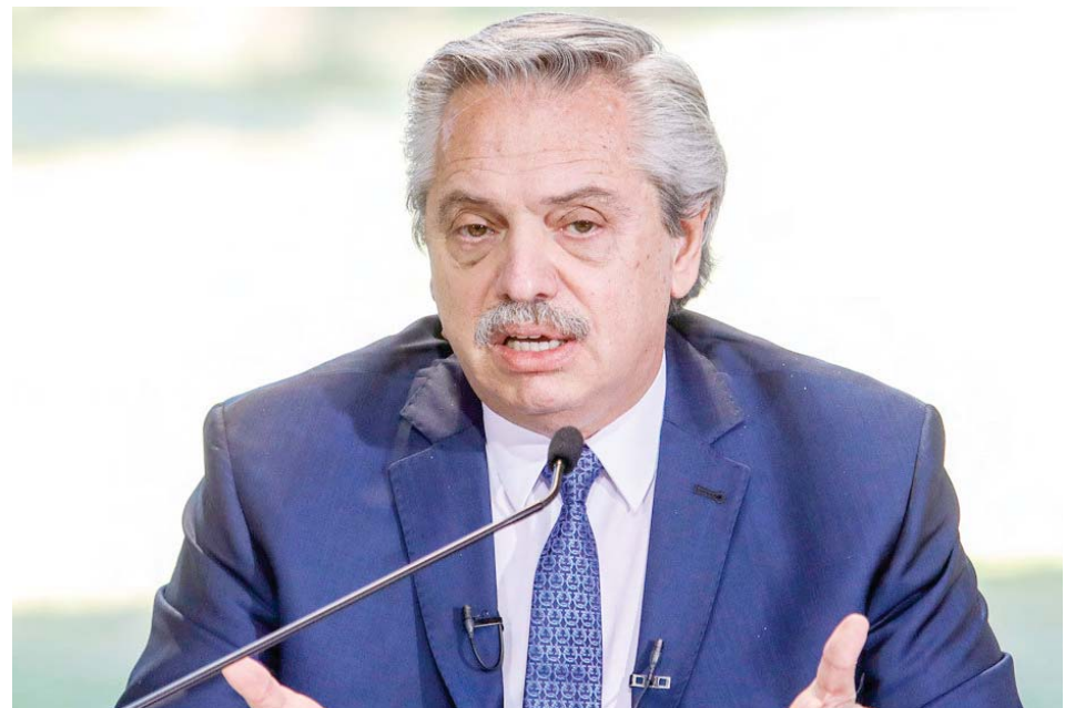
En Argentina algunos califican las restricciones para adquirir dólares como una devaluación encubierta

El Gobierno argentino anunció el pasado martes la implementación de nuevas restricciones para la compra de dólares en Argentina, lo cual ha generado inquietud entre la población, ya que considera que la medida podría impactar a los ahorristas de clase media, que intentan preservar parte de sus ingresos debido a los elevados precios.