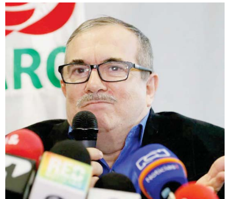
La FARC pide al Gobierno que garantice la seguridad de los guerrilleros desarmados

El presidente Iván Duque fue elegido con el lema de cambiar el acuerdo de paz con FARC, pues considera que está a favor de los exguerrilleros y ha hecho oídos sordos a los reclamos de endosar la seguridad de los combatientes desmovilizados. Además culpa de las masacres a los guerrilleros supuestamente albergados en el lado fronterizo de Venezuela. Esta versión