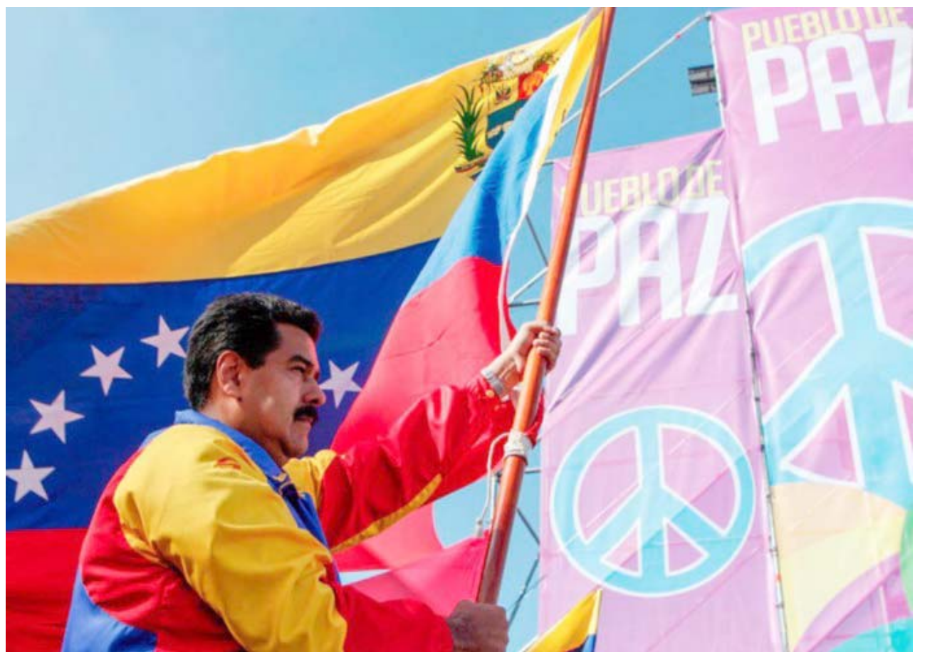
La estrategia política del presidente Maduro siempre ha tenido como eje la paz de Venezuela

del Pentágono o el Departamento de Estado puedan procesar. Si le sumamos la variable Hugo Chávez y el rearder bolivariano en el siglo XXI, sus sofisticados ordenadores de última generación sencillamente arrojan “error” o borran estas variables del algoritmo para que sus programas puedan correr, sin recalentar las costosas computadoras.