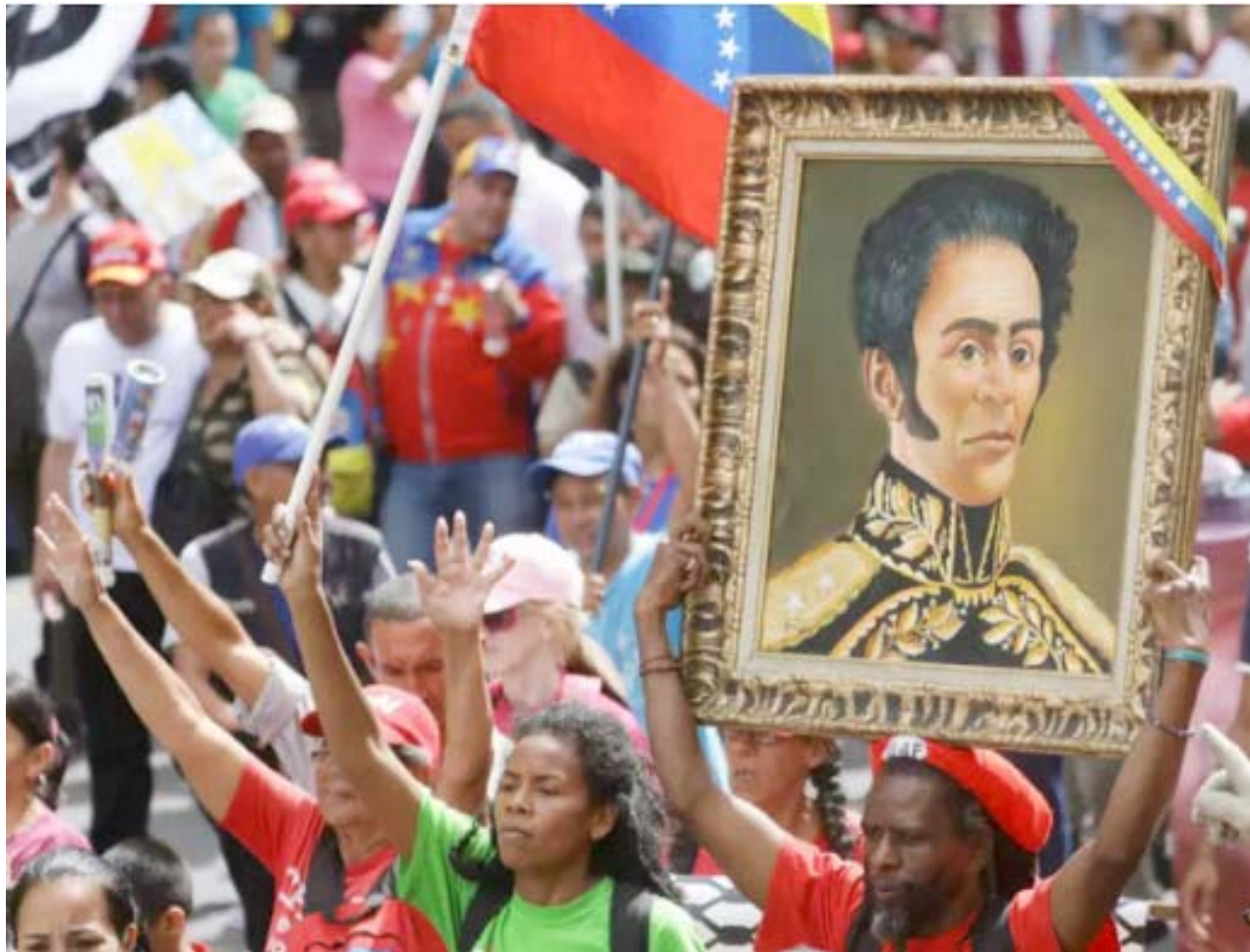
Marcha por la paz y la unidad de los pueblos, celebración del XXV Encuentro del Foro de Sao Paulo

Pero también en el sentido táctico. Chávez propició innumerables acciones para generar espacios de diálogo entre los venezolanos. Incluso en los peores momentos de violencia de la oposición, durante el golpe de Estado de 2002, siempre tendió la mano para buscar la concordia. Y si habláramos de lo que significó Chávez para el proceso de paz en la vecina Colombia, no alcanzarían las palabras para describir su vocación, entrega y acción: siempre buscando la concordia entre los hermanos. Este es un principio humanista que solo encontramos en su espíritu de vocación social.