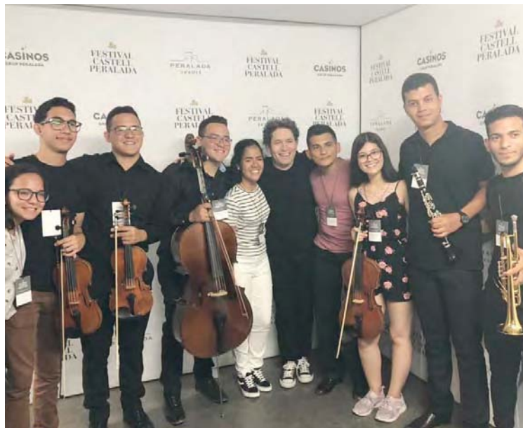
Participan músicos formados en el sistema venezolano de orquestas

El maestro Dudamel estuvo en las instalaciones del Parque Cosmo Caixas, un complejo de edificios ubicados en las afueras