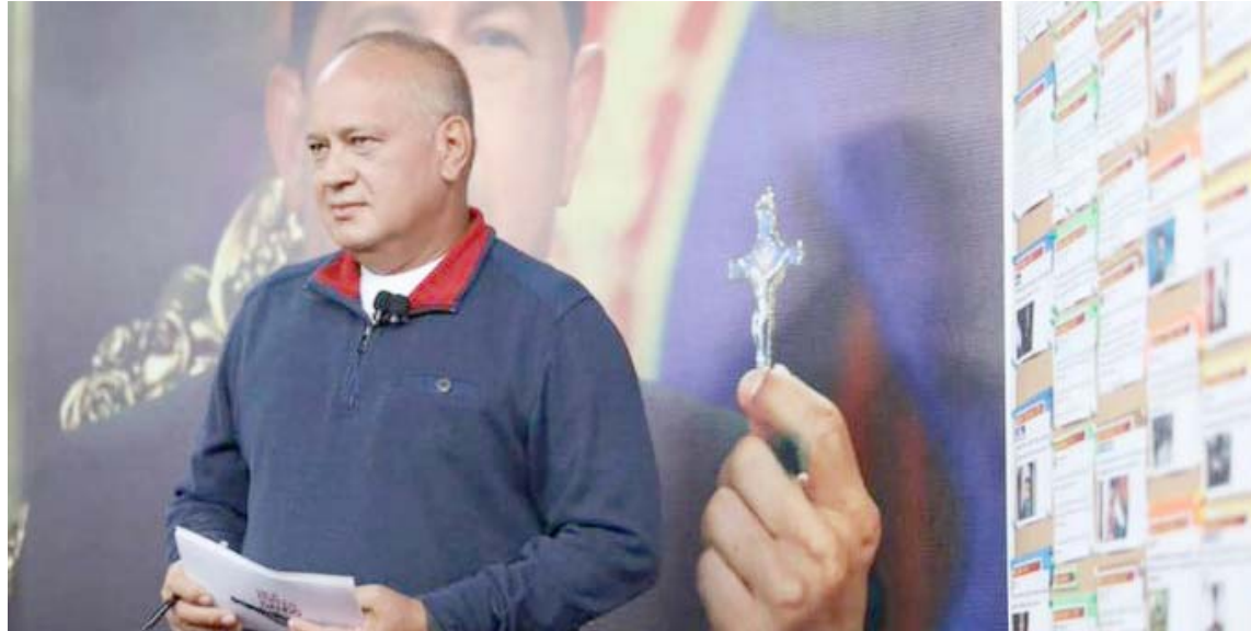
“El GPP no debe caer en provocaciones, que peleen solos”, expresó Cabello

T/ Leida Medina Ferrer F/ Con el Mazo Dando Caracas