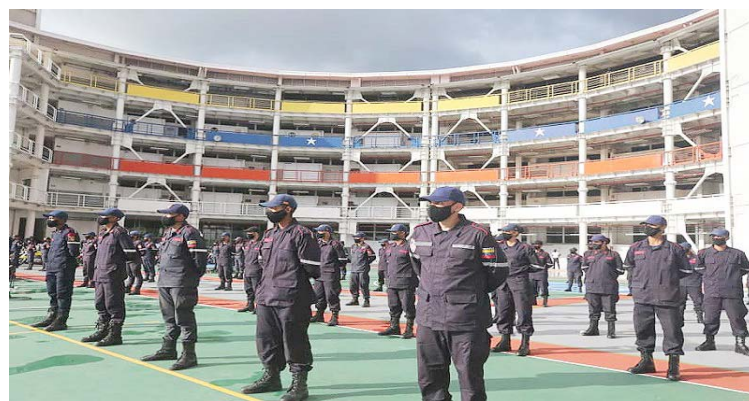
La UNES inicia recepción de documentos para la preinscripción

Al respecto, en una nota de prensa del Ministerio del Poder Popular para Relaciones Interiores, Justicia y Paz, Cacioppo señala que con el propósito de mantener la formación continua y profesionalización de los funcionarios activos, “se va a rea-