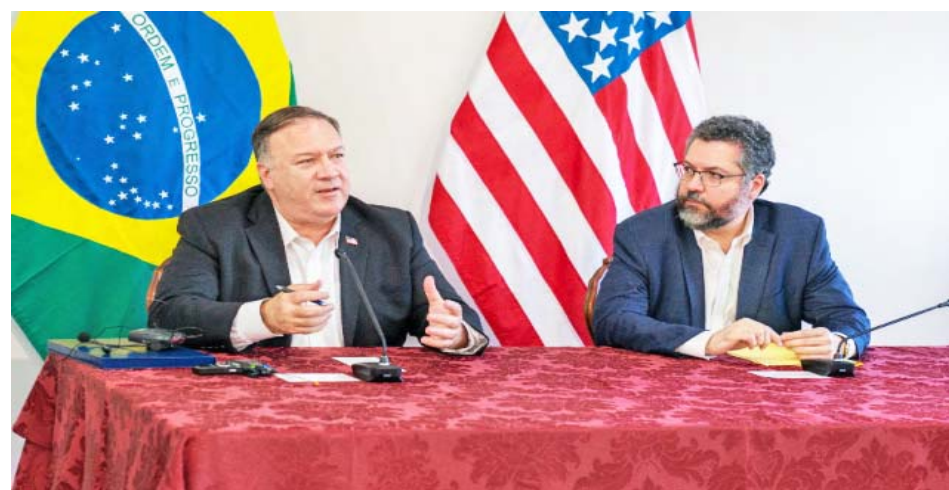
“Es una gira para unir mentiras y mentirosos”, dijo el Presidente cubano

Rodríguez destacó que en Estados Unidos 200.000 personas mueren de la Covid-19 debido a la manipulación