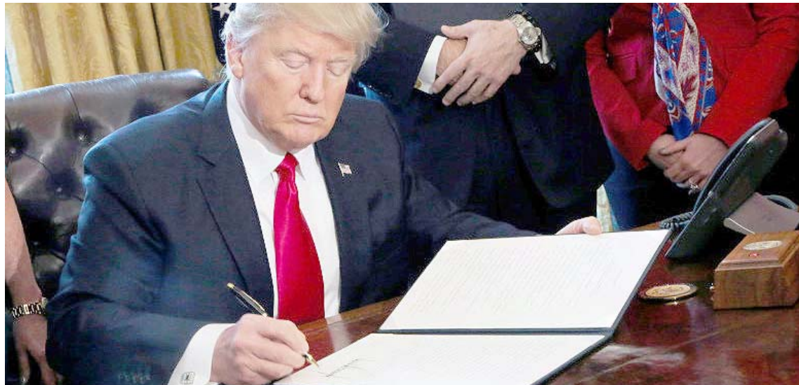
La nueva orden de Trump bloquea la propiedad en EEUU de quienes cooperen con Irán

Trump dijo que su administración nunca permitirá que Irán tenga un arma nuclear, “ni permitirá que Irán ponga en peligro al resto del mundo con un nuevo suministro de misiles balísticos y armas convencionales”, afirmó el Mandatario. Y agregó: “Mis acciones son un mensaje claro a aquellos en la