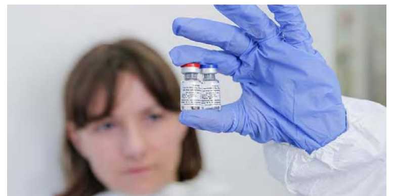
La vacuna del Centro Chumakov pasa a la fase de ensayos clínicos

En Moscú se han inscrito 60 mil voluntarios para participar en las pruebas clínicas de la vacuna Sputnik V, elaborada por investigadores del Centro Gamaleya, la cual está en la fase tres, que permitirá corroborar su eficacia.