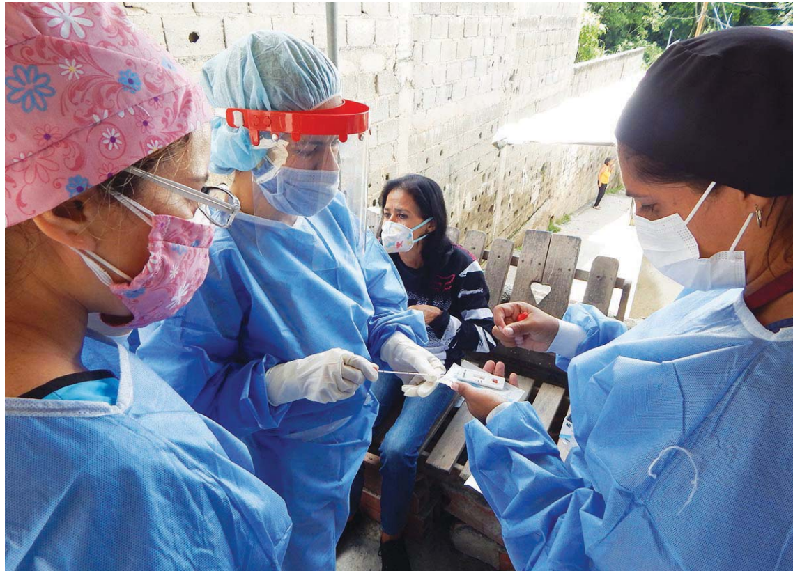
Se deben cumplir estrictamente con las medidas de bioseguridad

Agregó que un equipo multidisciplinario de la alcaldía, integrado por más de 60 personas, entre médicos, directores, funcionarios policiales, se encargan de garantizar la atención permanente 24 horas al día.