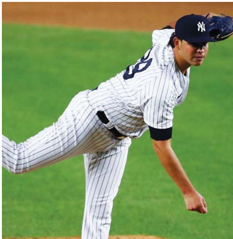
Yajure debutó en grande con los Yankees

Fue el quinto cambio en las últimas 48 horas para San Diego, que además Clevinger recibió al jardinero Greg Allen y