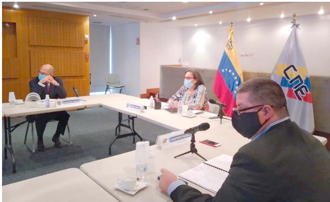
Autoridades del CNE señalan la importancia de la transparencia del proceso electoral

En nota de prensa, el CNE señala que la nueva solución tecnológica fortalece el sistema electoral, ya que afianza las garantías electorales que el Poder Electoral ha construido a lo largo de 16 años, con la experiencia acumulada y la evolución propia del sistema electoral, que es el pilar funda-