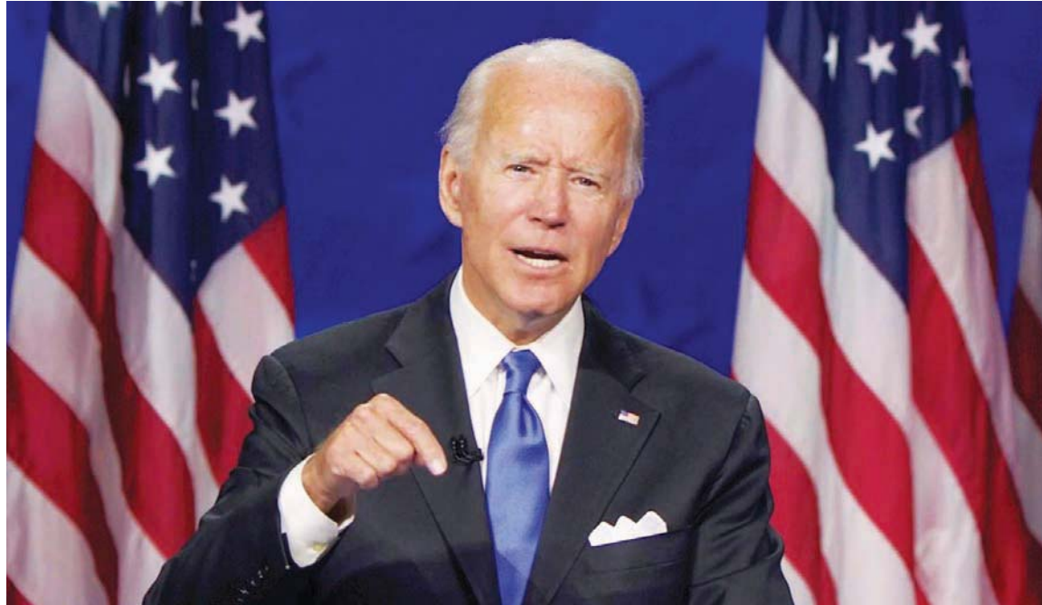
Joe Biden dijo que las políticas erradas de Trump han hecho más fuerte a Nicolás Maduro

“Es un fracaso abyecto desde que Trump asumió el cargo, y Nicolás Maduro se ha