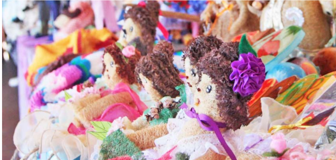
La programación del evento incluye tres conversatorios además de una exhibición

M uñequeras del estado Zulia y de otras partes del país participarán con sus obras en el Encuentro de Muñequeras y Muñequeros Maracaibo 2020, iniciativa que se consolida aún más con esta quinta entrega, siempre con el objetivo de vigorizar el arte de la muñequería, multiplicar y difundir los saberes tradicionales en el área y proponer, a partir de una discusión constructiva, el papel de la muñequería como símbolo de resistencia, como herramienta de reflexión