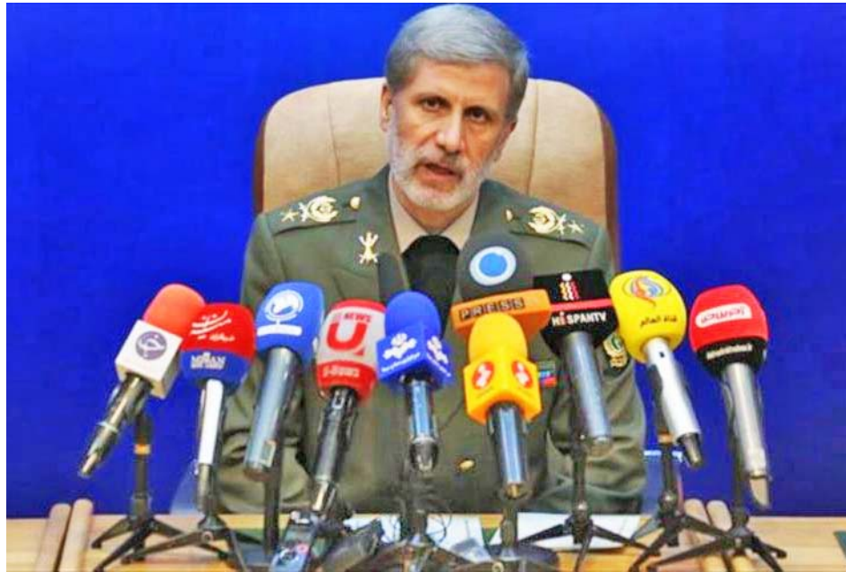
El ministro de Defensa, Amir Hatami, dijo que no tolerará que se afecte la seguridad en sus fronteras

La advertencia la hizo durante un acto oficial celebrado en la ciudad de Mashad, donde expresó: "La vida de los ciudadanos y la seguridad del territorio y las fronteras iraníes constituyen una cuestión importante y vital para nosotros, por lo que resulta del todo inacep-