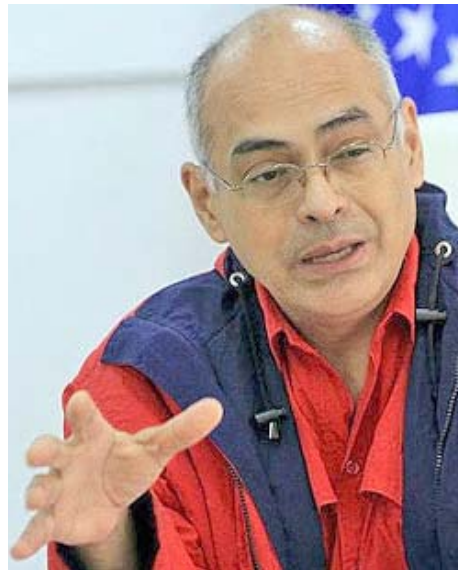
Este mes llegará al país la vacuna china para los ensayos de tercer nivel, anunció Alvarado

La información la ofreció Alvarado en contacto telefónico con el programa Dando y Dando conducido por el vicepresidente sectorial para el Desarrollo Social, Aristóbulo Istúriz, y la primera