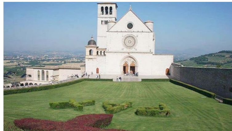
La Basílica de San Francisco

para salvaguardar la propia dignidad, un don de Dios. En el trasfondo de la Encíclica está la pandemia de Covid-19 que – revela Francisco – “cuando estaba redactando esta carta, irrumpió de manera inesperada”. Pero la emergencia sanitaria mundial ha servido para demostrar que “nadie se salva solo” y que ha llegado el momento de que “soñemos como una única humanidad” en la que somos “todos hermanos” (7-8).