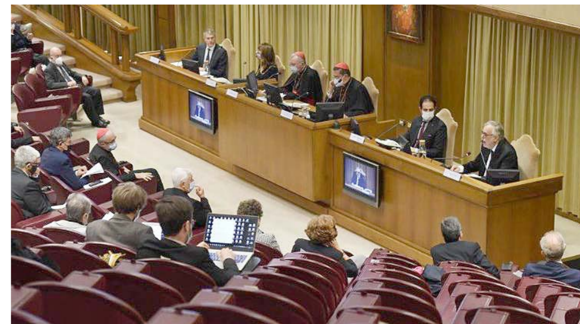
Conferencia de presentación de la Encíclica Fratelli