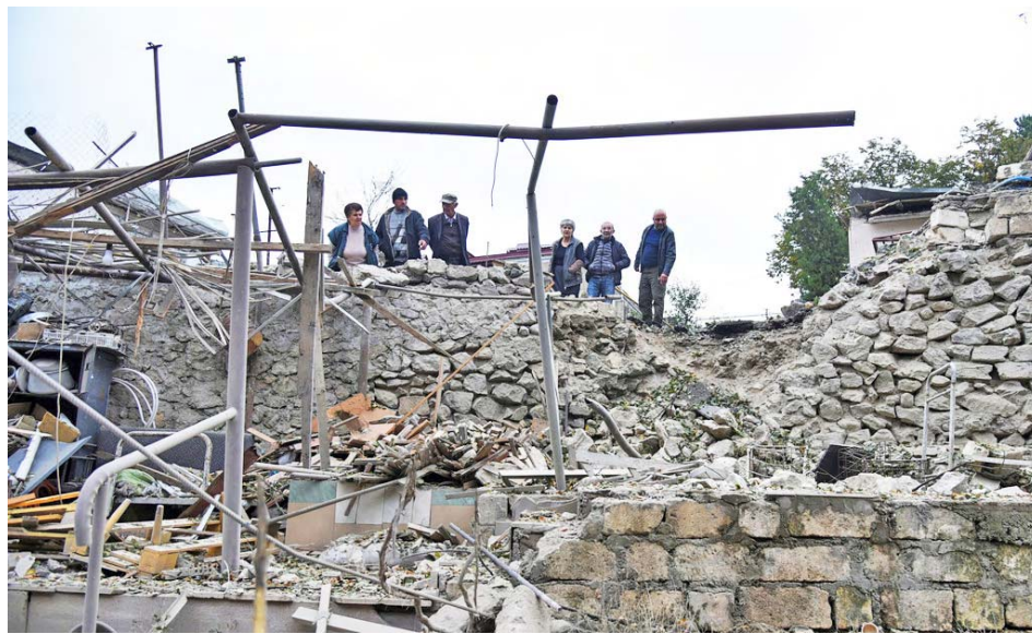
En los ataques que llevan 9 días en Nagorno Karabaj, han fallecido decenas de civiles

Según las autoridades de Armenia y Azerbaiyán desde la escalada de este conflicto el pasado 27 de septiembre, han