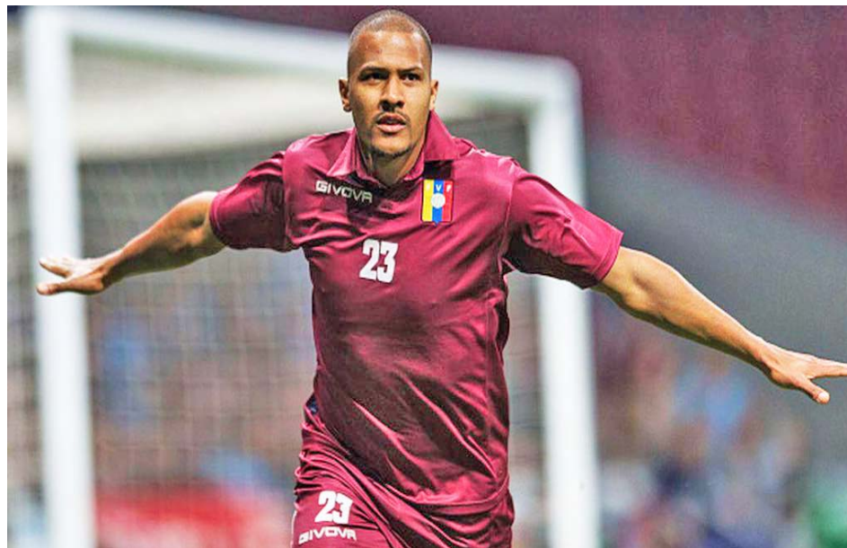
Rondón es líder histórico en goles con 24 para la selección nacional

A la sensible baja del máximo artillero de la selección nacional, Salomón Rondón, también se le suman la de los criollos que juegan en la Major League Soccer (MLS), de Estados Unidos. Se trata de los mediocampistas José «El