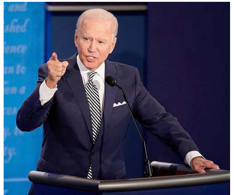
En Arizona, Joe Biden muestra una ventaja de 8 puntos porcentuales frente al presidente Donald Trump

En el estado de Arizona, donde comenzó la votación anticipada ya se inició el envío de boletas por correo procedió al envío de boletas por esta semana.