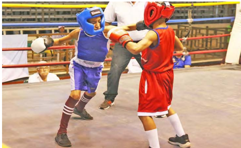
Una nueva camada se preparará para el año entrante

Como segunda línea reiteró la importancia del Plan de Flexibilización Deportiva: “Ya hemos presentado a la