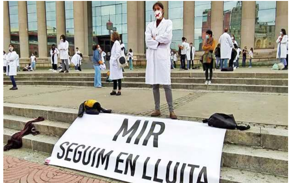
Los trabajadores sanitarios españoles denuncian que los sueldos son miserables

Los trabajadores insisten en que los sueldos no les alcanzan, se sienten maltratados y menospreciados. Reclaman más medidas, inversión y más recursos para el sistema sanitario por la pandemia del nuevo coronavirus, ya que temen que los hospitales colapsen de