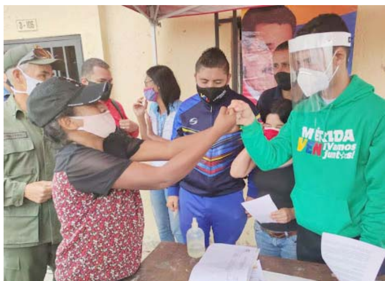
El simulacro medirá el tiempo del elector durante el recorrido por la herradura