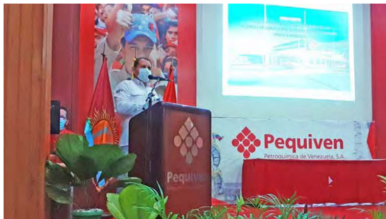
La clase obrera está siempre activa para aumentar la producción