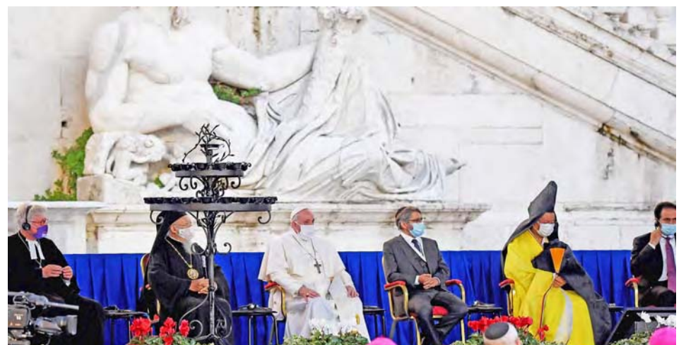
En el encuentro ecuménico oraron por las víctimas de la pandemia

El papa Francisco, de 83 años, durante el encuentro ecuménico celebrado en la Basílica de Santa María, por primera vez en un acto público usó mascarilla,