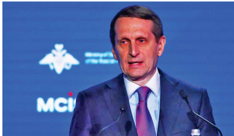
Serguéi Narishkin dijo que funcionarios estadounidenses persuaden a fuerzas de seguridad

En un comunicado el funcionario ruso dijo: "Hoy vemos que los estadounidenses están orquestando un escenario revolucionario para Moldavia en noviembre en el marco de los próximos comicios",