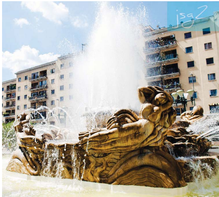
Las Toninas en la fuente de la Plaza O'Leary de Caracas es un disfrute para los transeúntes

El legado de este creador margariteño, Premio Nacional de Pintura 1940 y Premio Nacional de Escultura 1948, es profuso y diverso: pintura, murales, relieves y escultura. Trabajó su arte bajo un criterio universal.