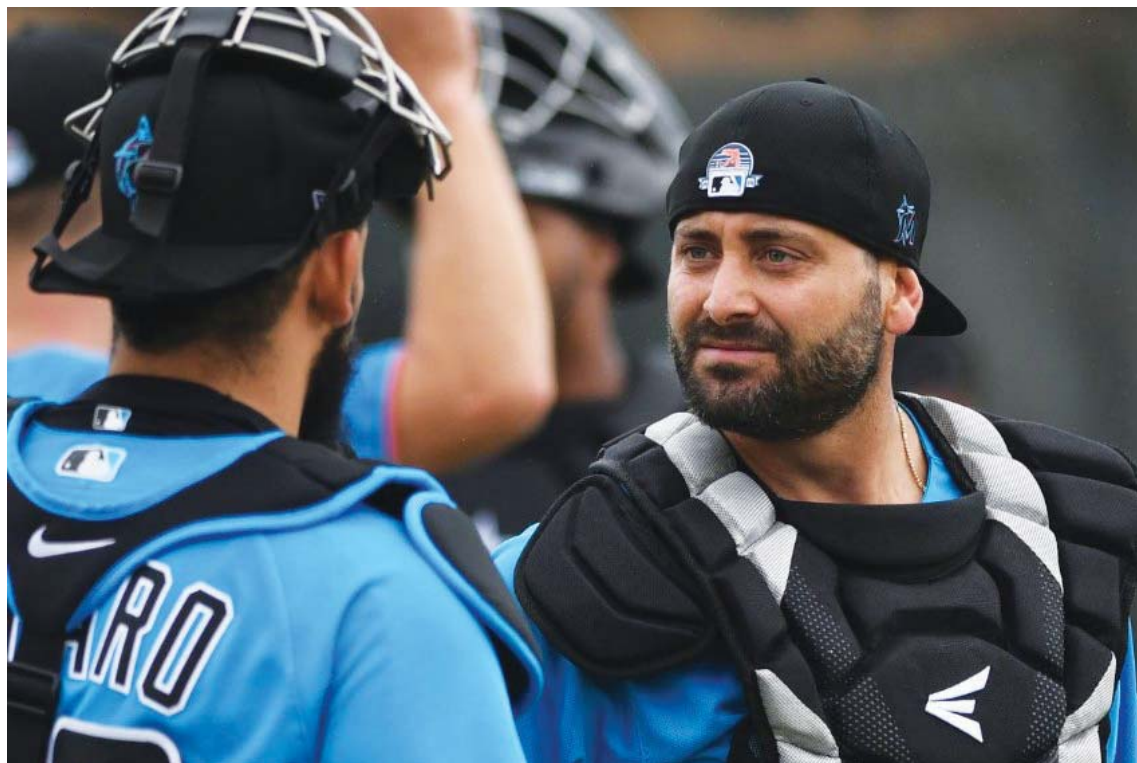
El valenciano se destacó por su buena defensa

En nota de prensa de Alexander Mendoza para prensa LVBP,