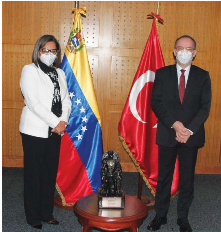
Poder Electoral recibe al embajador de Turquía

Además, la directiva del Poder Electoral evaluó lo concerniente a las normas y protocolos que regirán la veeduría nacional, e internacional, las cuales se han planteado de forma presencial y bajo formatos y herramientas digitales en tiempo real para garantizar la participación, tomando en cuenta los elementos de bioseguridad que han estado presentes a lo largo del proceso.