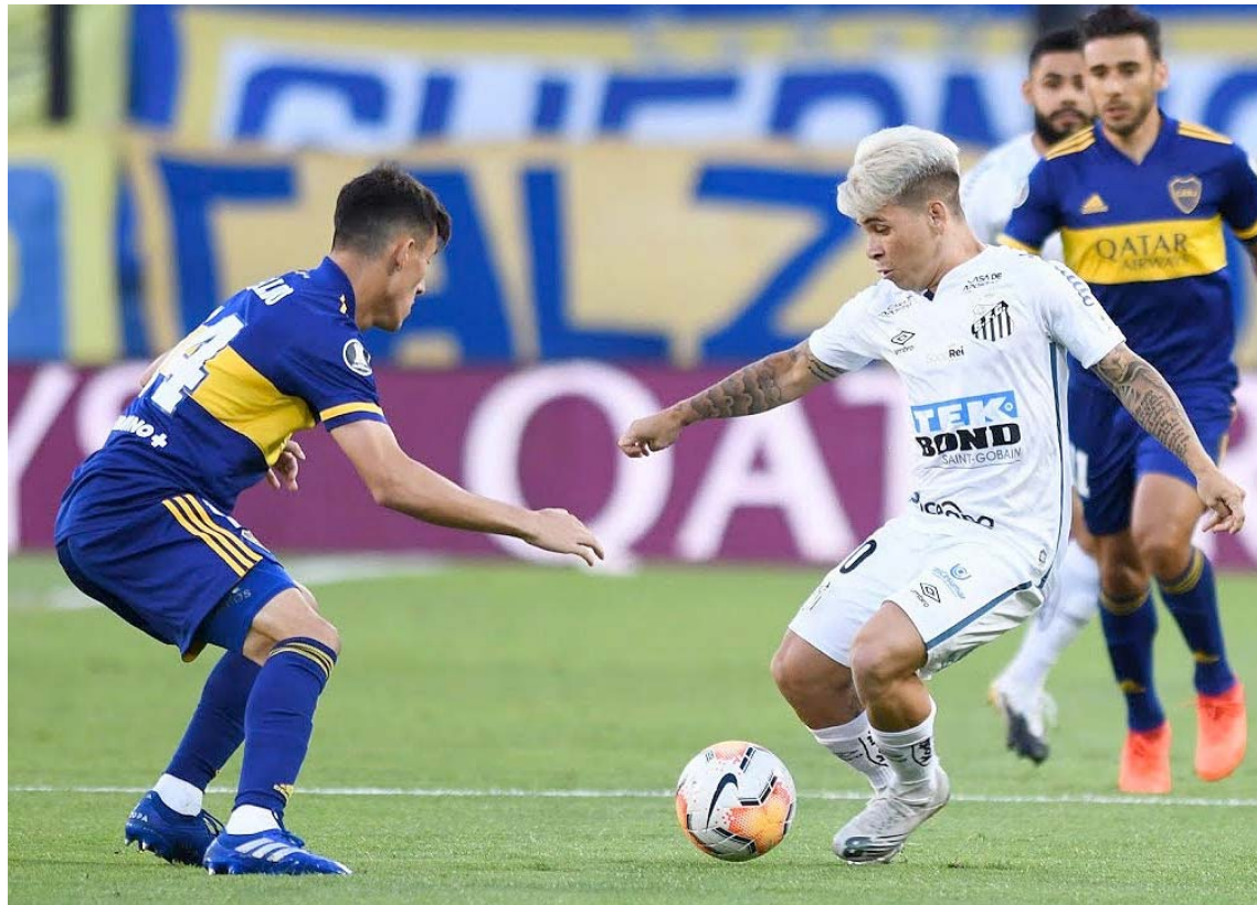
Soteldo sigue comiéndose la en Brasil

El estadio Vila Belmiro (vacío en modo pandemia) fue testigo del dominio del Santos, que ya al minuto 16' por intermedio de Diego Pituca lograba vacunar a los Xeneizes.