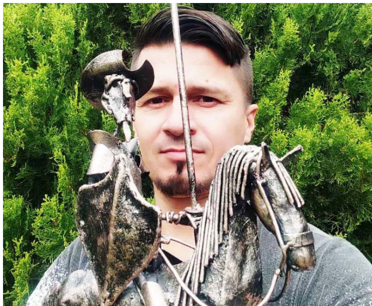
El Quijote ha sido una figura inspiradora en la trayectoria de este creador