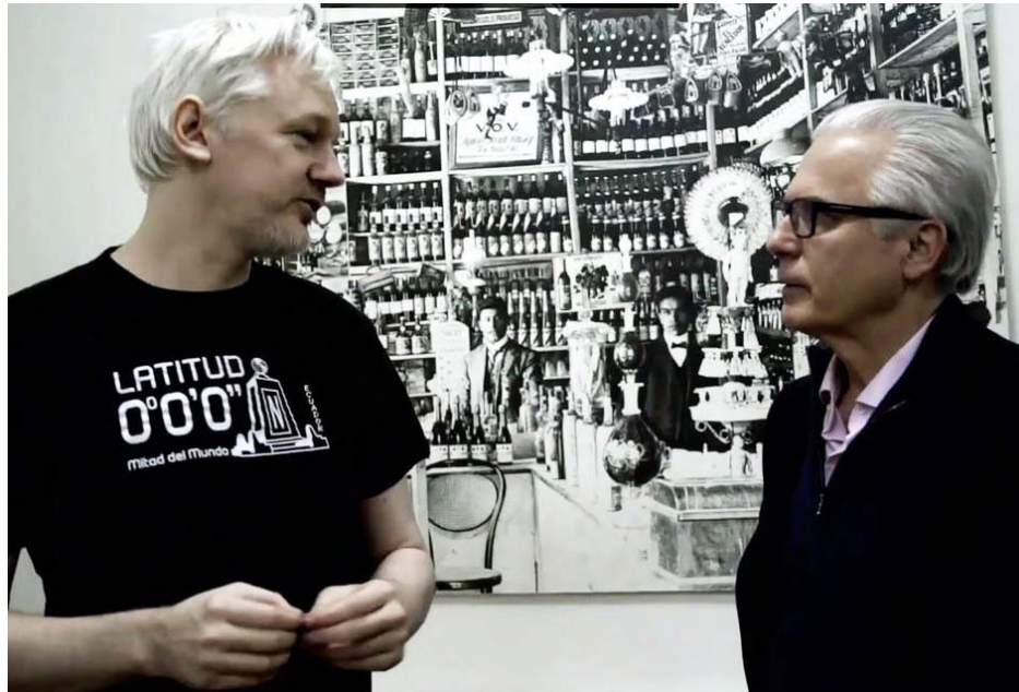
Julian Assange y Baltasar Garzón

Julian Assange plantó cara y ha pagado por ello. Le acusaban de cometer 18 delitos, 17 de ellos bajo Ley de Espionaje de 1917 –ya ven de qué época hablamos– y uno relacionado con la supuesta ayuda informática a la militar Chelsea Manning, quien alega