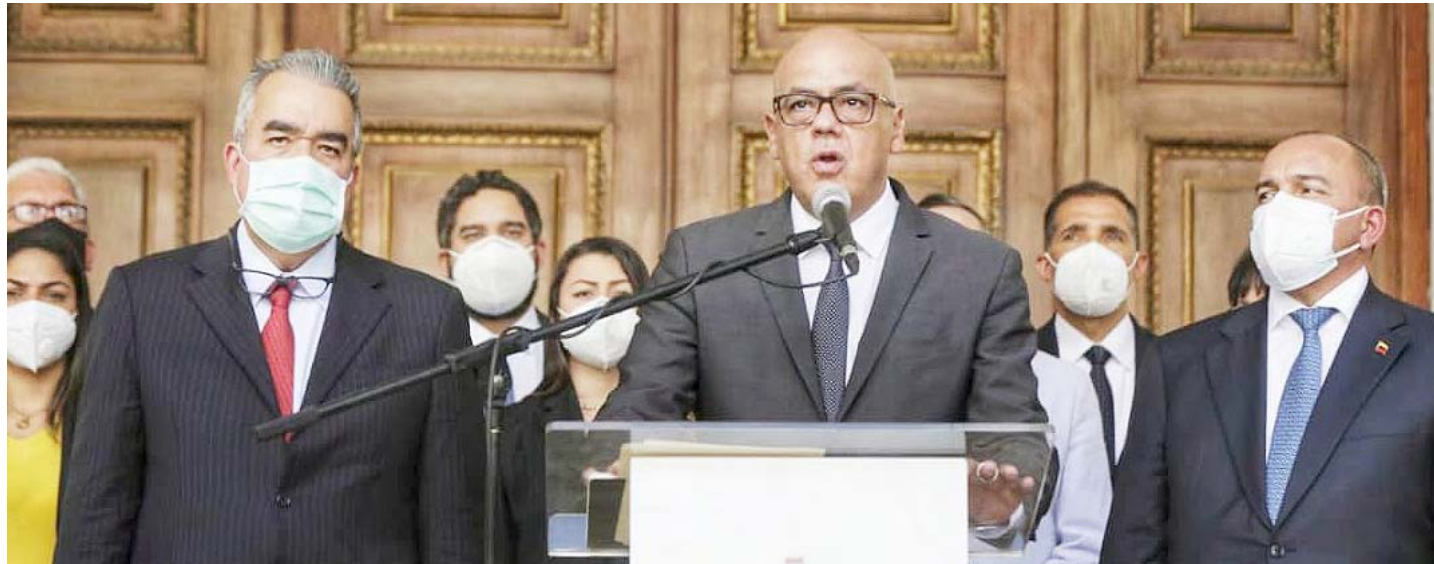
Comisiones de la AN funcionarán en el edificio que ocupó la ANC

Era un cambio necesario en vista de la nueva cantidad de integrantes del Parlamento, explicó el diputado Diosdado Cabello