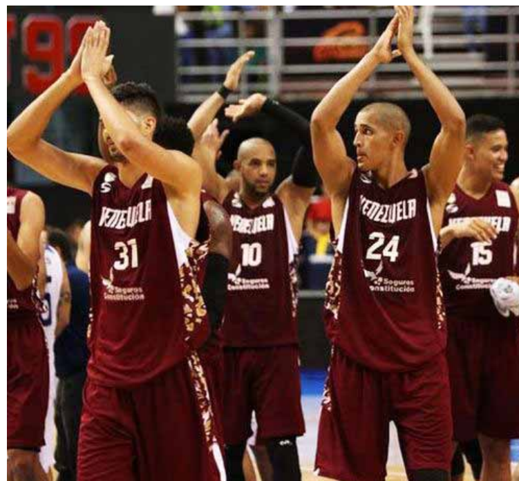
La selección nacional buscará generación de relevo

En el último mes y principios de este se llevó a cabo la realización de las Eliminatorias Regionales U17 en las regiones: Central, Oriental, Centro-Occidental y Occidental, dando a los 8 equipos clasificados para el