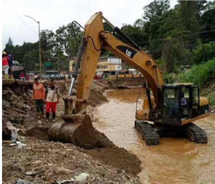
El gobierno local trabaja día y noche

“Durante el despliegue visitamos a ocho familias con la finalidad de evaluar y tomar nota de los daños causados a sus viviendas; de las cuales tres sufrieron pérdidas totales, por lo que decidimos trasladarlas hasta los refugios transitorios activados por la