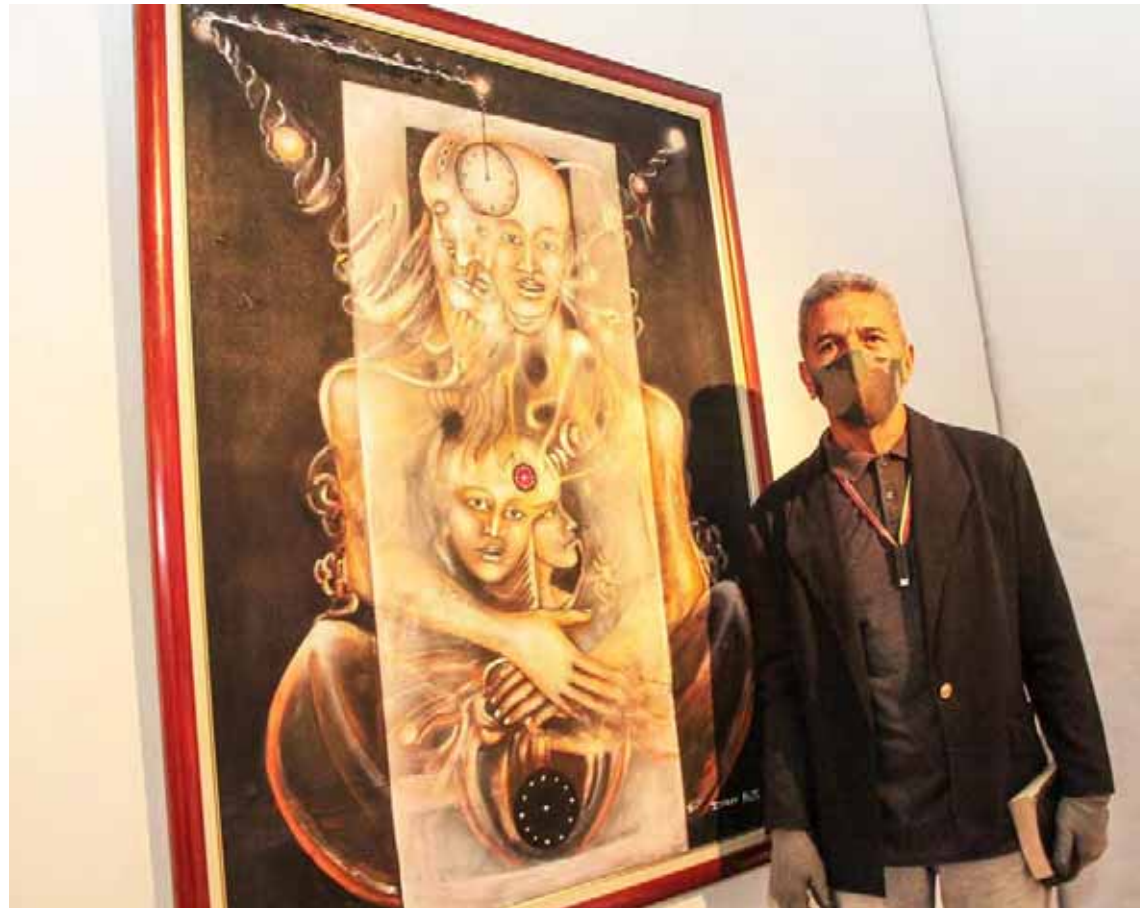
“Tiempo implacable” es la obra con la que participa en el Museo de Petare