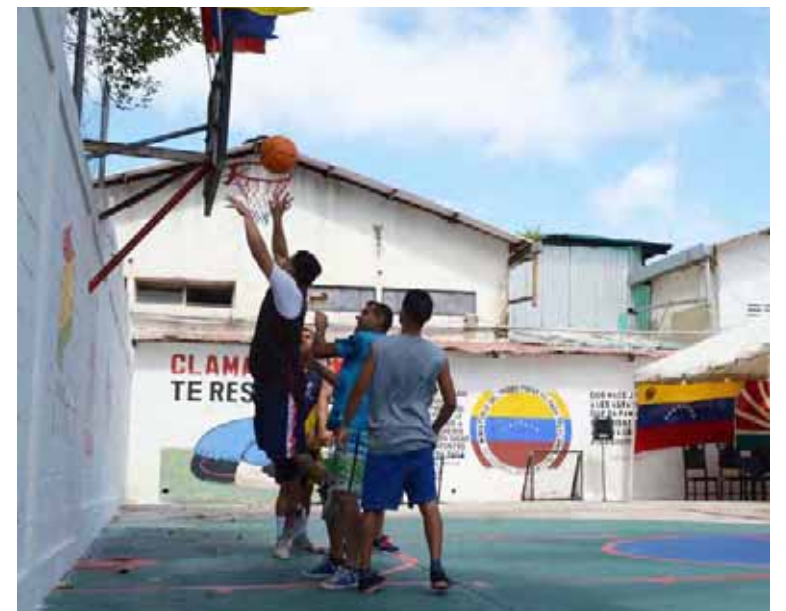
El deporte también redime al hombre

Por su parte, el comandante de la Policía, Peña Quevedo, señaló que hubo participación de los privados de libertad: “Ellos estuvieron involucrados en la remodelación del espacio, ya que representa para los mucha-