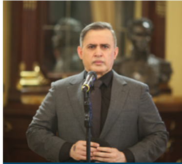
Tarek William Saab

A la presentación de informes de actualización de casos que recogen el avance en las causas y las reformas destinadas a garantizar la defensa de derechos humanos, la agilización de procesos penales y la protección de los reclusos, la Fiscalía de la CPI respondió “con silencio”, comunicó el fiscal general de la República, Tarek William Saab, el 13 de junio de 2021. Ante ello, la Sala de Cuestiones Preliminares reconoció el interés de verdadera cooperación de Venezuela e indicó que la Fiscalía de la Corte Penal Internacional también debía colaborar con Venezuela – bajo el principio de complementariedad positiva- antes de determinar la apertura de una investigación formal.