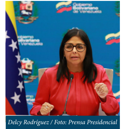
Delcy Rodríguez

La inacción del Ministerio Público “promovió la impunidad, que se cometieron hechos de esta naturaleza”, afirmó la entonces presidenta de la Asamblea Nacional Constituyente (ANC), Delcy Rodríguez.